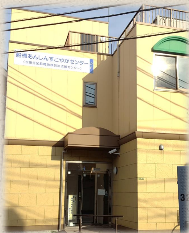
世田谷区の木「欒（けやき）」

「あんしんすこやかセンター」は介護保険法に基づく「地域包括支援センター」です。 東京都世田谷区では親しみやすいように「あんしんすこやかセンター」と呼んでいます。