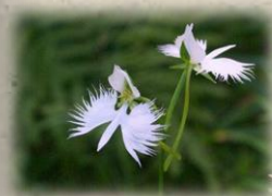
世田谷区の花 さぎそう